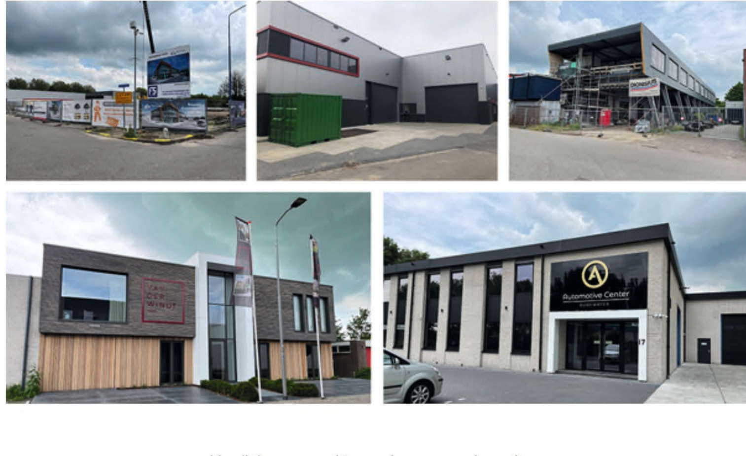
Van links naar rechts van boven naar beneden: B&V Techniek, De Wit Aggregaten, Avant Accountants, Aannemersbedrijf van der Windt en Automotive Center Oudewater

Zie hier een greep uit de huidige nieuwbouw/verbouwactiviteiten op Tappersheul. Ook de realisatie van nieuwbouw en/of re-freshing van onze bedrijfspanden draagt bij aan een nog nettere en strakkere uitstraling van ons bedrijventerrein. We wensen de ondernemers veel succes met hun nieuwe aanwinst!